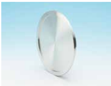
上記の写真は FBF です。